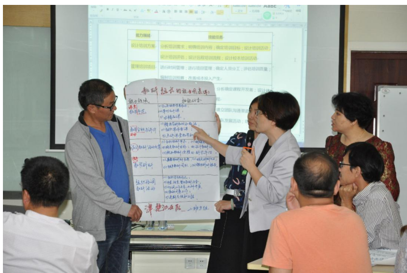
DACUM 工具应用体验的课堂教学场景

培训管理者培训特别注重学习成果的应用价值，在示范性国培培训团队研修项目的每一课程主题中除了提供针对教师培训组织管理问题的对策与方法，还提供相对应的实用工具、支架、模板、案例，有利于研修成果的外显，促进学习成果在工作实践中的应用。例如，运用鱼骨图分析培训需求；运用 DACUM 能力图表工具、ASK 分析法确定培训框架；运用 ABCD 分析法撰写培训目标；运用最佳实践萃取法丰富学习内容；运用 AAR 工具设计学习活动；运用柯氏四级评估培训设计；运用“5-3-1 行动计划”工具，制定明确的行动计划等。以上这些方法工具均会在培训期间通过虚拟情境下的应用体验，促进参训教师结合工作实境进行反思迁移，从而提升培训的应用成效。此外，培训中涉及的方法工具介绍、应用案例分析、拓展阅读资料等都已编撰成册，作为参训学员的学习教材，也作为课程系统的重要组成部分，充分体现课程实施的规范性与专业性。